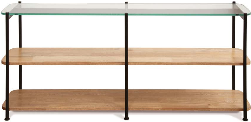
Consola Lima superficie en vidrio.