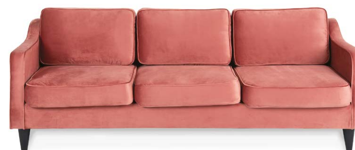
Sofá Moscú 3 puestos en terciopelo rosa antiguo.