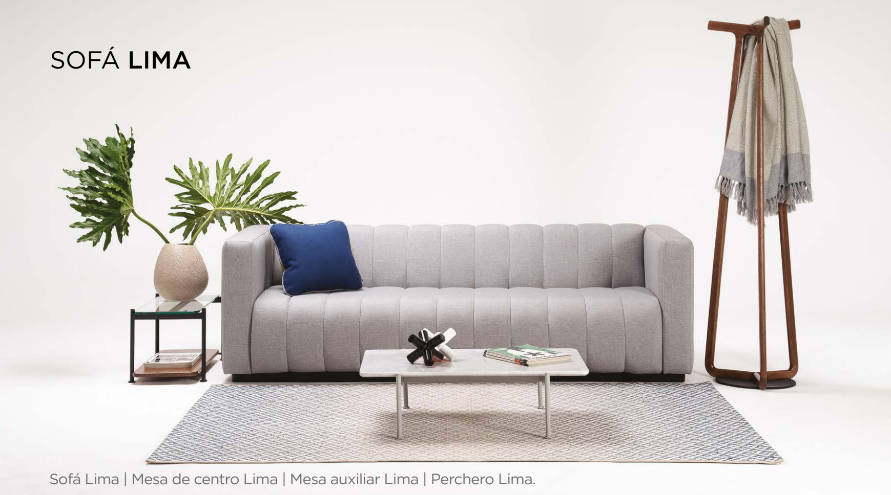
Sofá Lima | Mesa de centro Lima | Mesa auxiliar Lima | Perchero Lima.