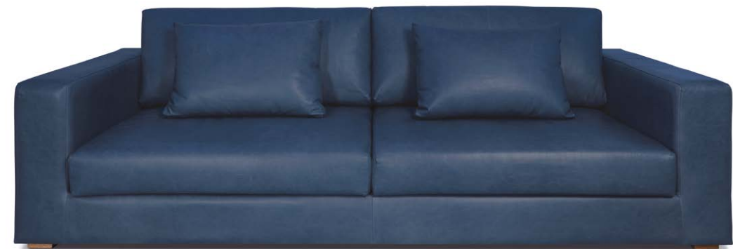
Sofá Camden 3 puestos en cuero azul índigo.