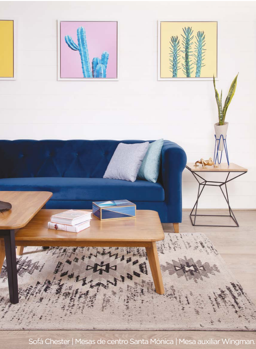
Sofá Chester | Mesas de centro Santa Mónica | Mesa auxiliar Wingman.

Elegir la distribución de la sala suele ser uno de los dilemas más comunes a la hora de diseñar y decorar tu hogar. Con esta guía y consejos verás que, de ahora en más, esos problemas de distribución son cosa del pasado.