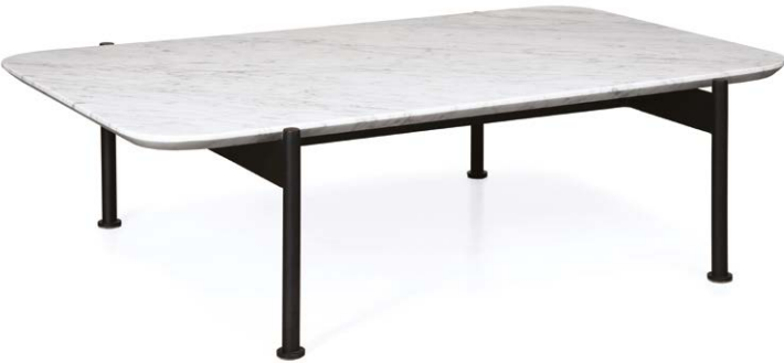
Mesa centro Lima superficie en mármol.