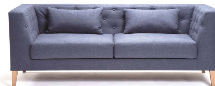
Sofá Oxford 3 puestos en tela azul amatista.