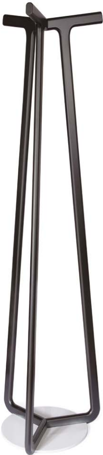
Perchero Lima $650.000