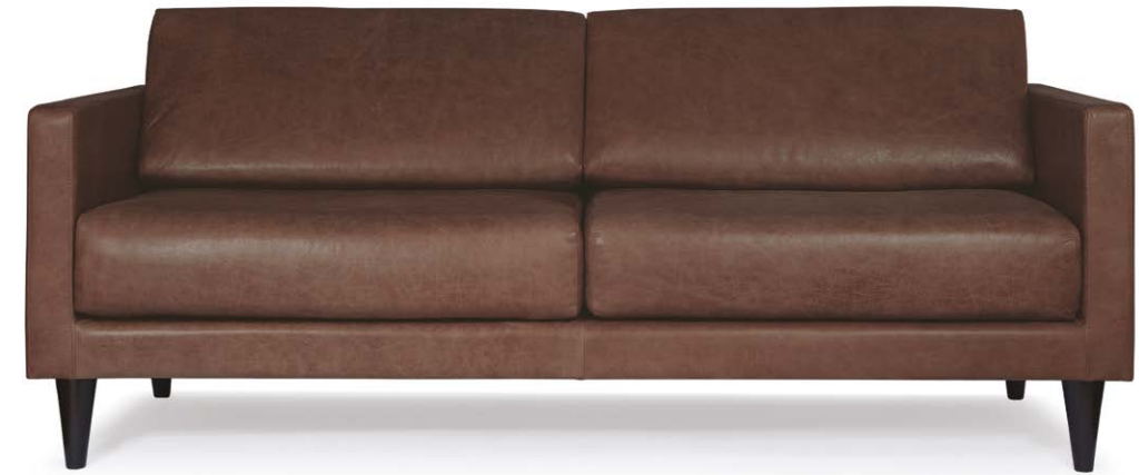
Sofá Miami 3 puestos en cuero apache chocolate.