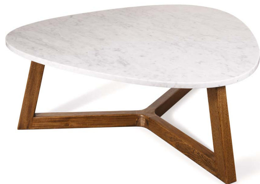
MESA DE CENTRO CAMDEN