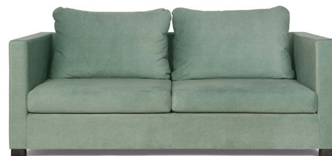
Sofá Lovebox 2,5 puestos en tela verde menta.