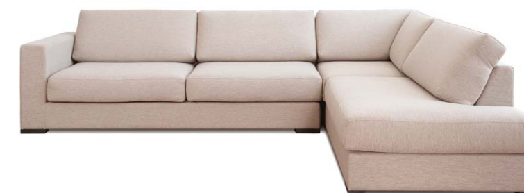
Modular Rimini en tela color crema.