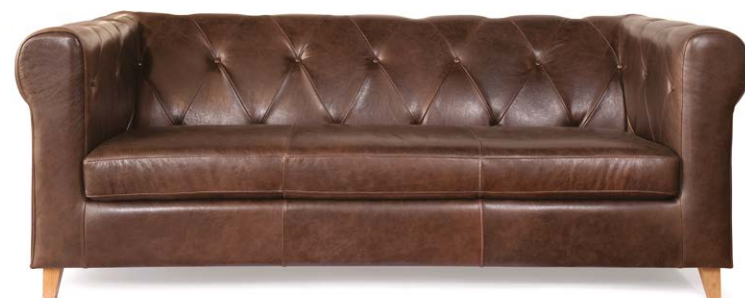
Sofá Chester 3 puestos en cuero marrón oscuro.