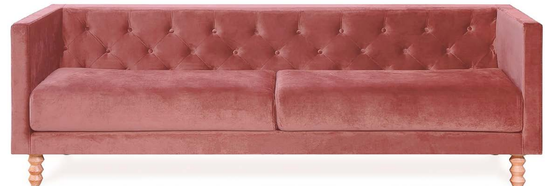
Sofá Del Sur 3 puestos en terciopelo rosa antiguo.