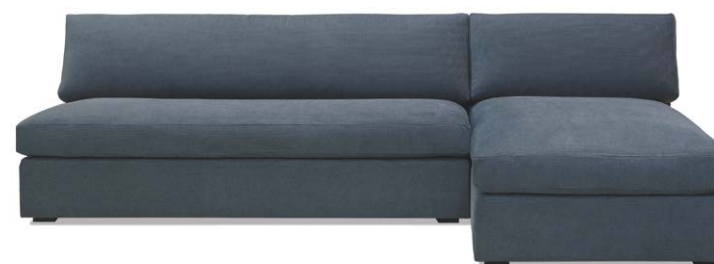
Modular Lisa en tela azul profundo.