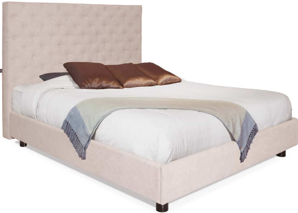
Cama Del Sur tamaño king en tela café pardo.