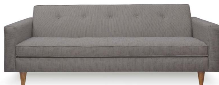
Sofá Nal Dal 3,5 puestos en tela gris acero.