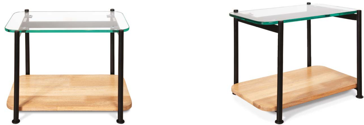
Mesa de noche Lima superficie en vidrio.