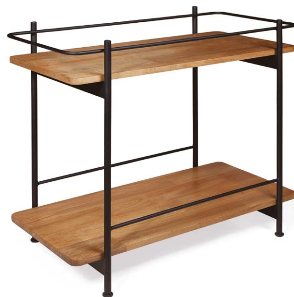
TV CABINET KONTRAST