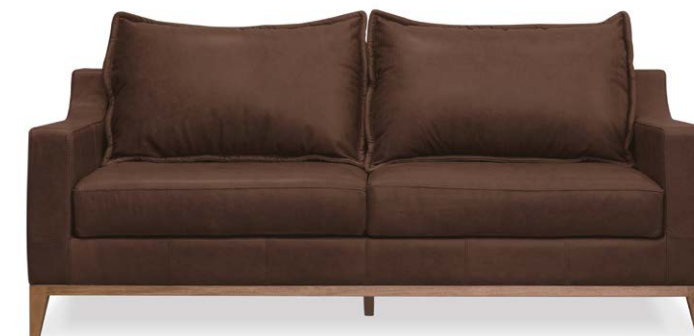
Sofá Malibú 2,5 puestos en cuero chocolate.

Tu casa y tu mente están conectados, en Bombox tenemos muebles para el bienestar de los espacios.