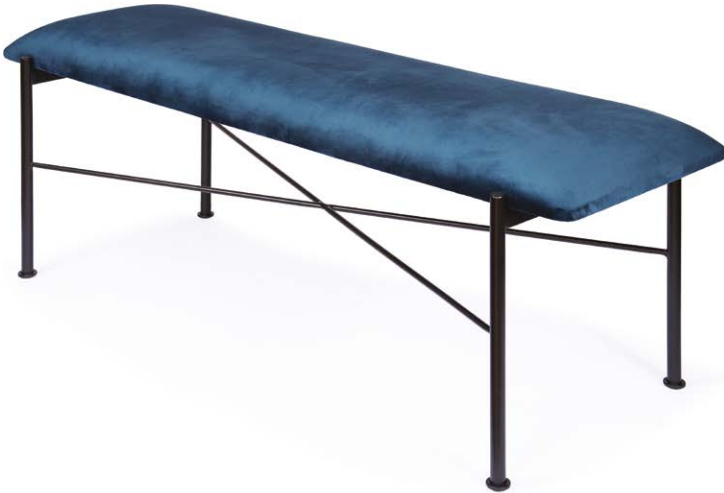
Banca Lima en terciopelo azul profundo.