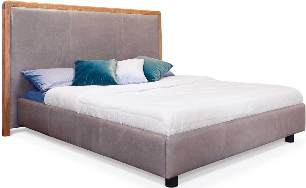
Cama Lima tamaño king en cuero gris roca.