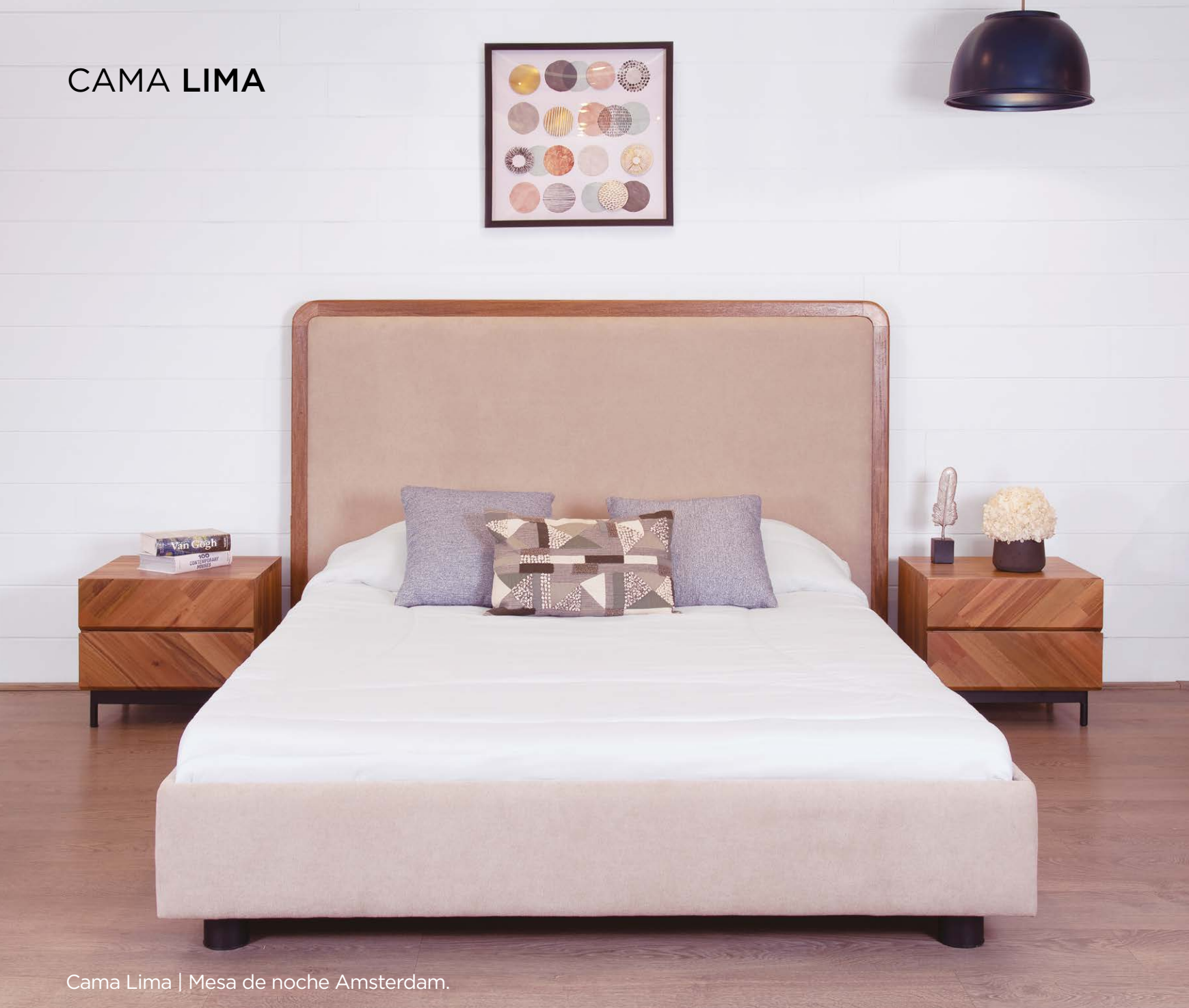
Cama Lima | Mesa de noche Amsterdam.