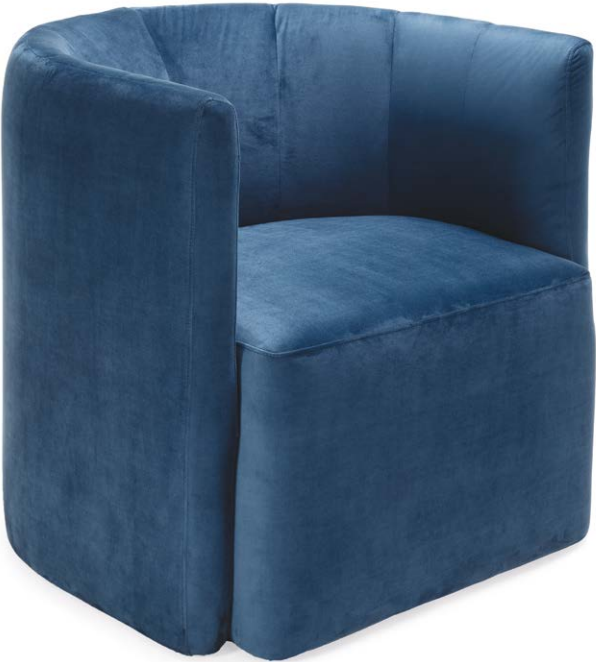
Silla sala Lima en terciopelo azul profundo.