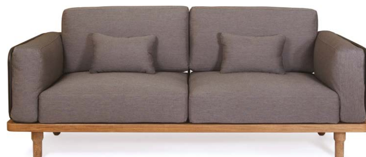
Sofá Grid 3 puestos en tela gris taupe.