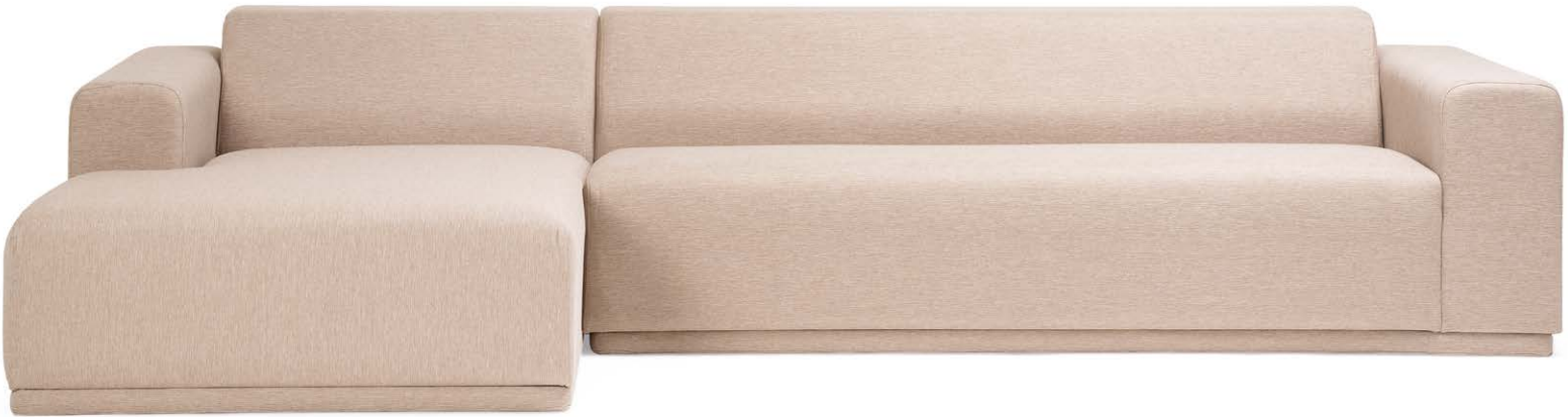
Modular Rio en tela color trigo.