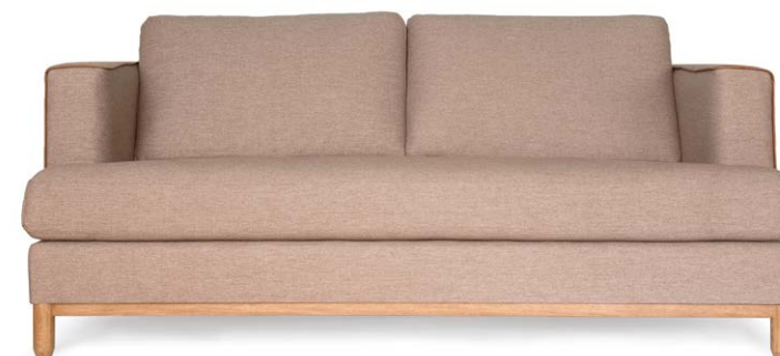
Sofá California 2,5 puestos en tela café pardo.