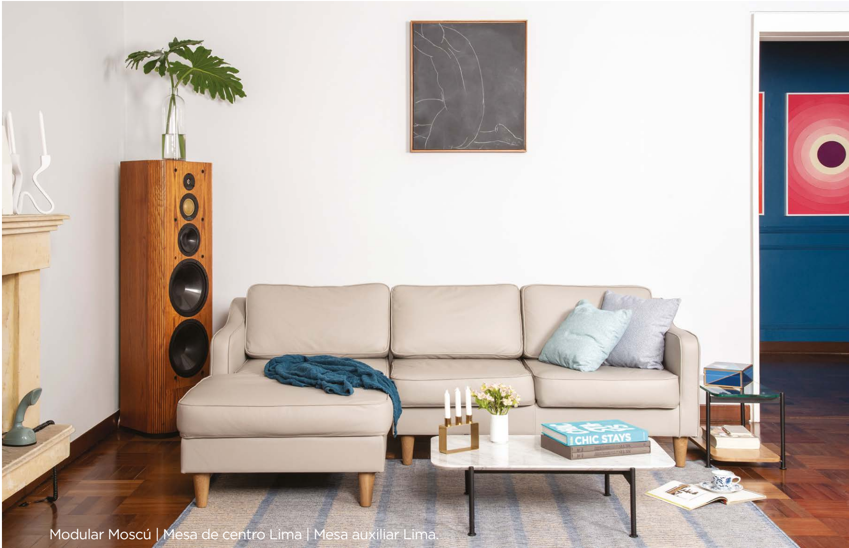
Modular Moscú | Mesa de centro Lima | Mesa auxiliar Lima.

*Sigue la imagen por columnas para acompañar cada descripción.