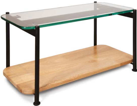
Mesa auxiliar Lima superficie en vidrio.