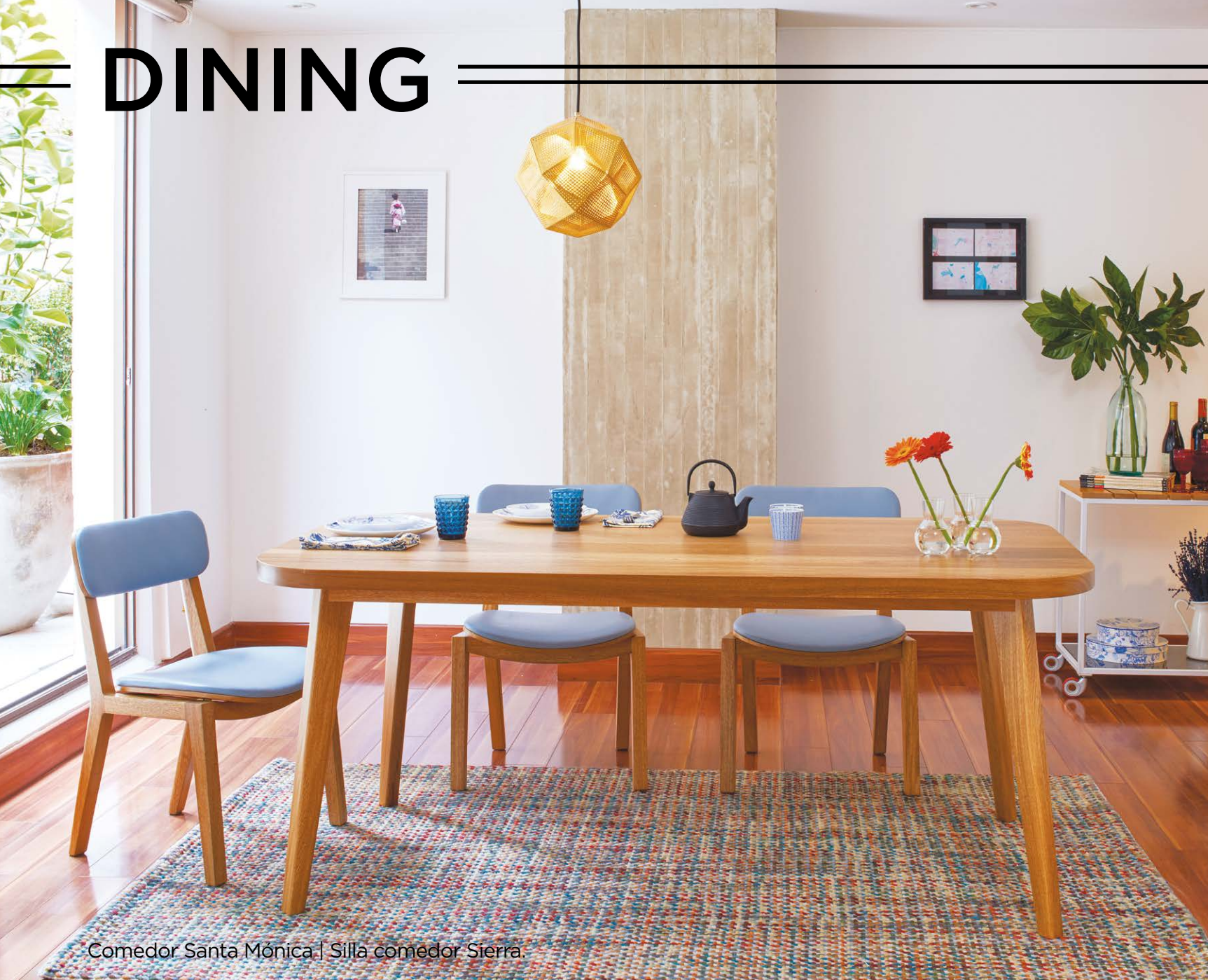
Comedor Santa Mónica | Silla comedor Sierra.